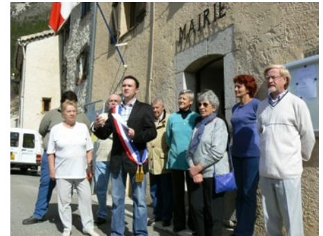
L'équipe municipale à votre service

Environ 150 personnes ont participé à la journée portes-ouvertes des édifices publics de la commune : gîtes, mairie, auberge, églises, salles et caves communales... avec visite guidée par les élus. La journée avait commencé par une prise de parole du nouveau Maire qui a souligné son souhait de faire de la politique autrement, en associant la population aux décisions et en communiquant en toute transparence sur les affaires communales. Un apéritif a ensuite été offert par les nouveaux élus.