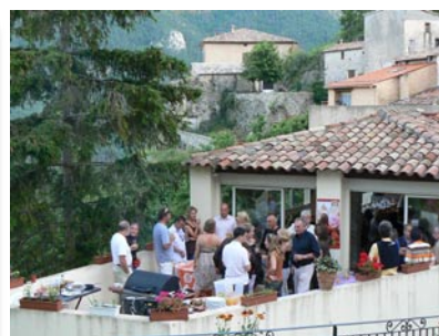
Fête de la musique 2008 à l'auberge

consistant à prendre le chemin communal qui, suivant le cours de la Gironde, vous mènera après quelques heures de marche