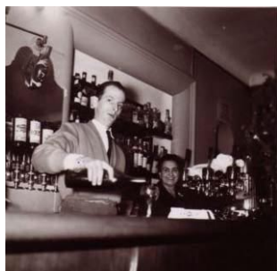
Réveillon 1956 à l'auberge

Il dispose d'autre part d'un ensemble de vastes caves voûtées très anciennes qui bénéficient, par leur conception, d'une climatisation naturelle en toutes saisons. Un repas à l'auberge du Charamel sera l'occasion de vous régaler de plats raffinés de grande qualité, œuvres d'un chef ayant fait ses classes dans des restaurants parmi les plus prestigieux de la planète.