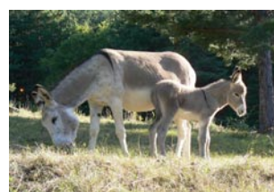
Sausses est né le 5 août 2008

De retour à l'auberge, vous découvrirez de nombreux produits artisanaux : le miel du Mas, le savon au lait d'ânesse fabriqué par notre ânier qui occupe avec ses 15 ânesses notre bergerie communale des Sausses, le pain d'épice de notre aubergiste qui pourra également vous faire déguster ses confitures, blocs de foie gras et autres succulentes fabrications maison.