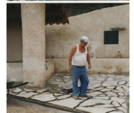
La fontaine Sainte-Anne