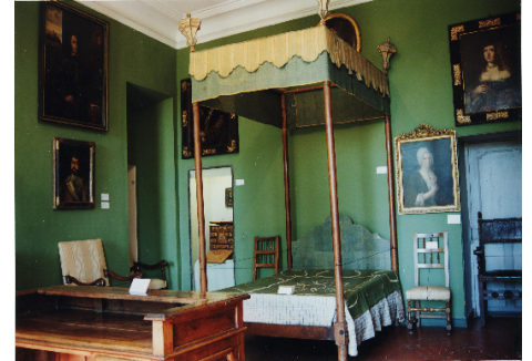
Lit du seigneur du Mas exposé au Musée d'Art et d'histoire de Provence à Grasse