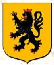
Armoiries de la famille de Grasse, écu d'or au lion de sable, armé, lampassé et couronné de gueules